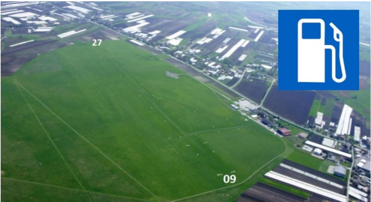
EPKP - Krakow Pobiednik / 980 * 120 m / Grass / 1000 * 50 m / Grass / Elevation: 664 ft.