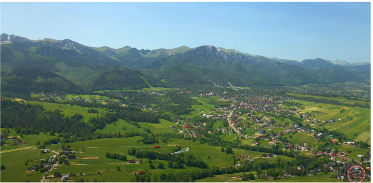
Nowy Targ / 1680 * 80 m / Grass / Elevation: 2060 ft.